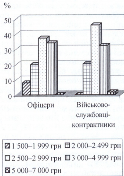
Рис. 3. Необхідний рівень грошового забезпечення військовослужбовців військової служби за контрактом з погляду респондентів

незабезпеченість житлом, соціальна незахищеність (відсутність реальних пільг), велике службове навантаження. Тому одне з основних питань забезпечення військовослужбовців військової служби за контрактом – це грошове утримання. У нашому дослідженні респондентам було запропоновано визначити його оптимальний рівень, який би задовольняв кандидатів на військову службу за контрактом. Офіцери та військовослужбовці військової служби за контрактом вважають, що мінімальний рівень грошового утримання контрактника повинен бути не менше 1 500 грн, а середній рівень грошового забезпечення – 2 500 – 3 000 грн (37,3 і 45,7 % відповідно) (рис. 3).